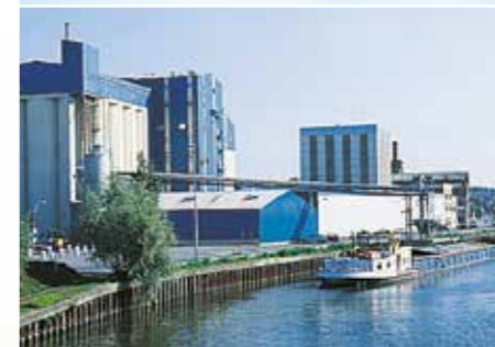
Werk in Valenciennes - Frankreich