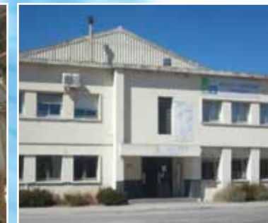
Werk in Arles - Frankreich