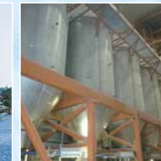
Parboiling in dem Werk in Arles